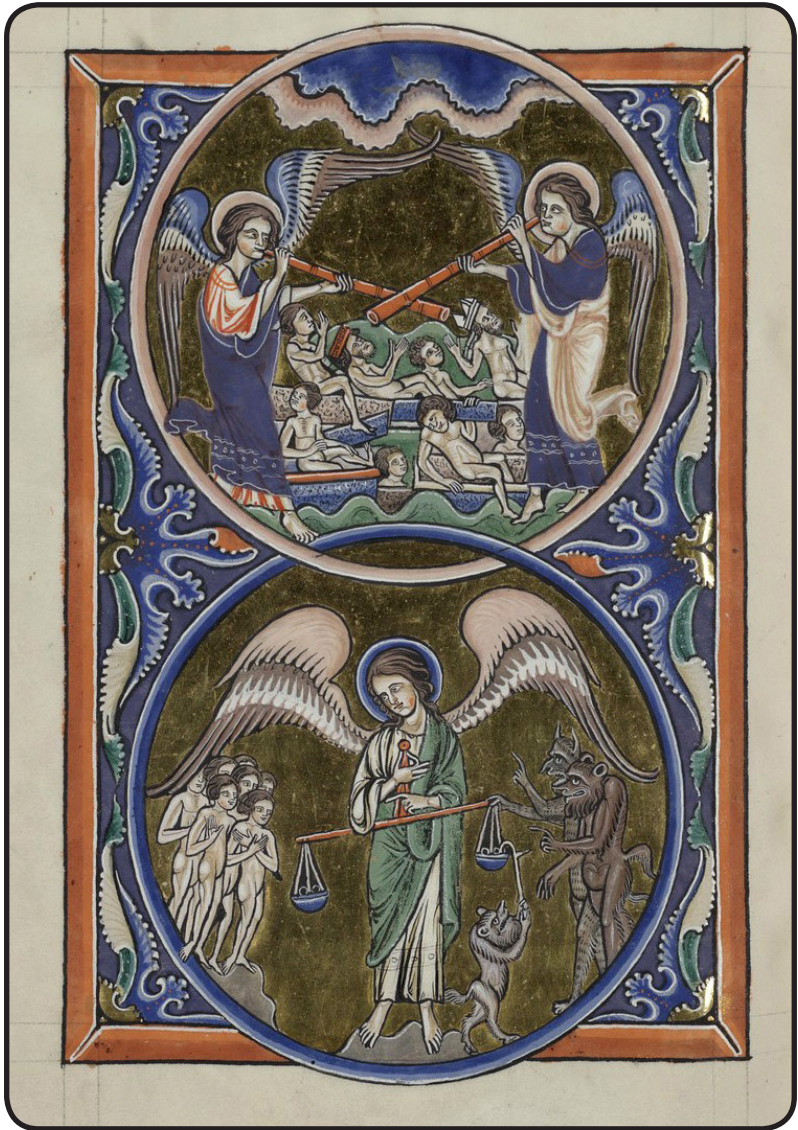
La pesée des âmes par St Michel

Psalterius 1225-35 psautier st. Louis et Blanche de Castille 169v arsenal