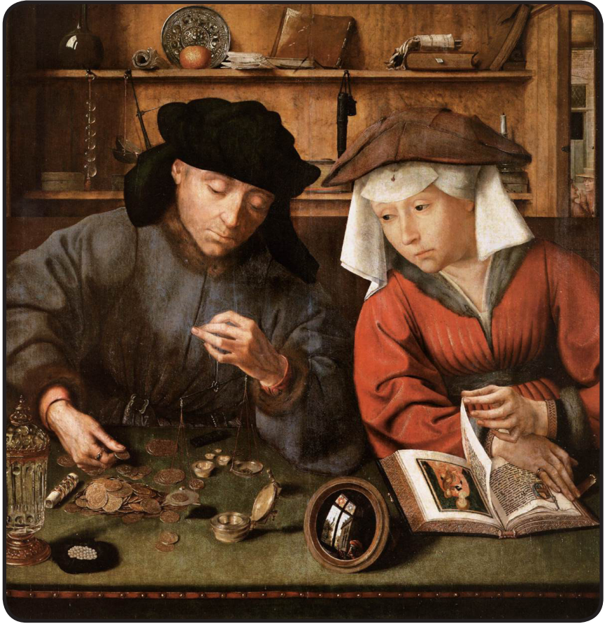
Quentin Massys, L'usurier et sa femme (1514) Huile sur panneau, 71 x 68 cm Musée du Louvre, Paris.