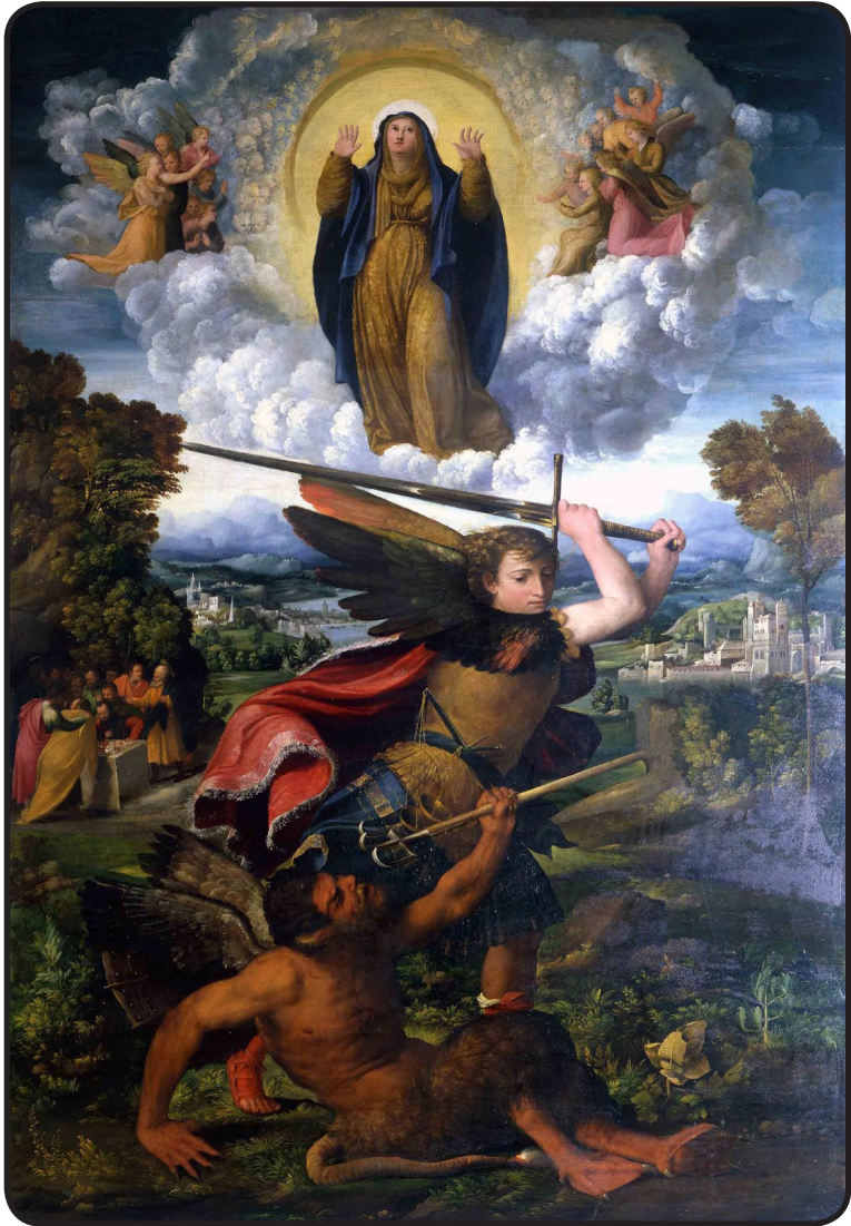
Dosso Dossi, L'archange Saint Michel terrassant le Démon , 1523 (Galleria Nazionale, Parme)