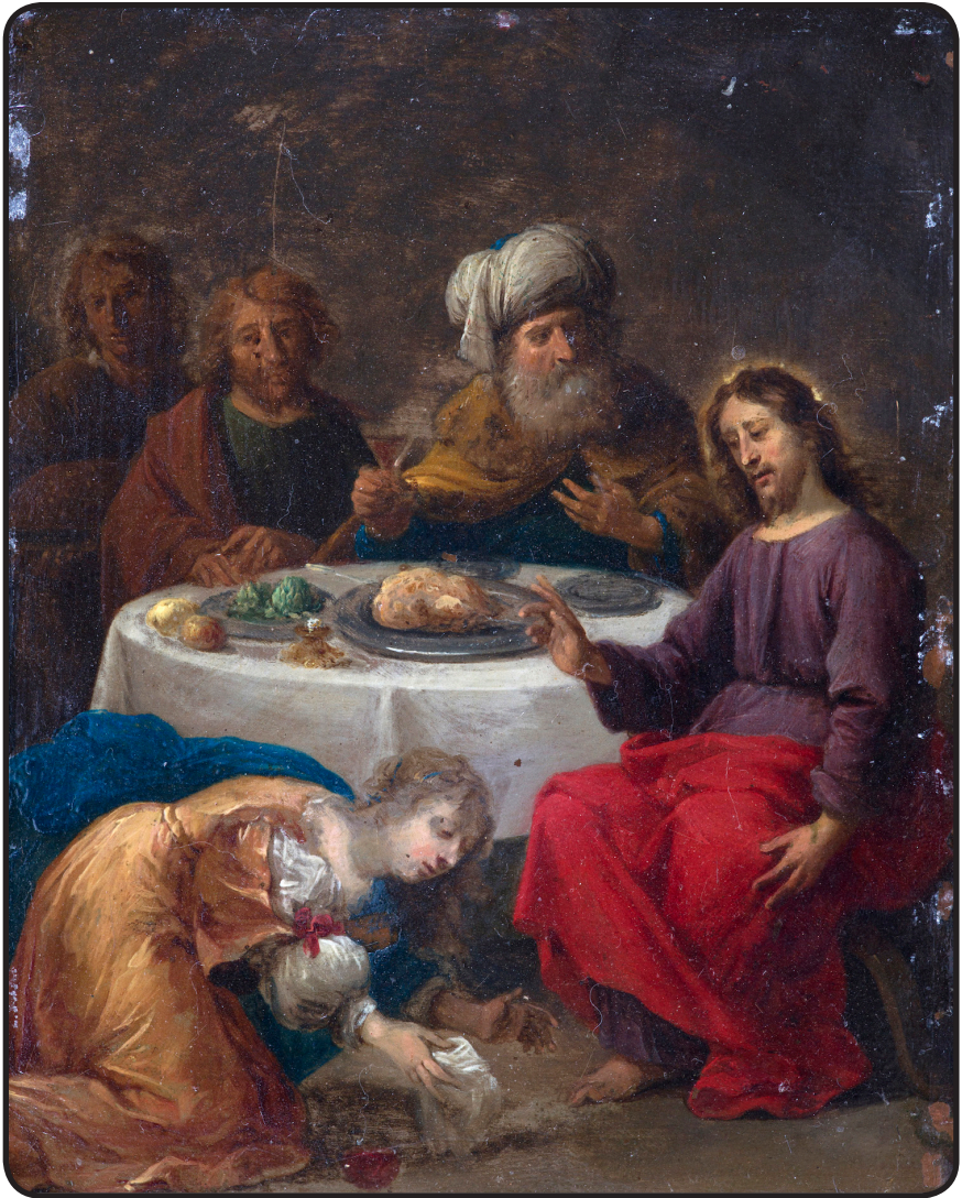
Le repas chez Simon le Pharisien, La prédication du Christ aux apôtres

ÉCOLE VÉNITIENNE, vers 1700. paire d'huiles sur cuivre (22.5 x 17.5 cm).