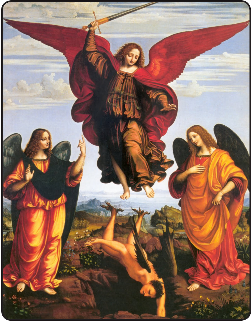
sub tutela michaëlis